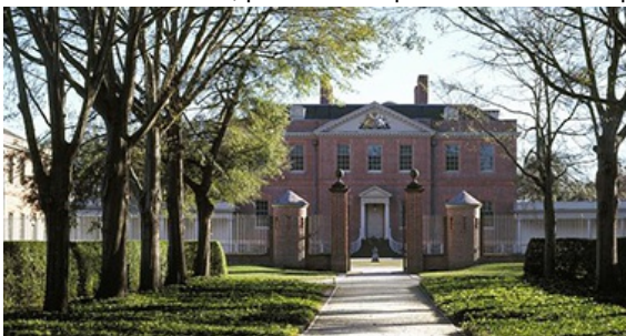
El Palacio de Tryon en New Bern.

En el 1868 se adoptó una segunda constitución, la cual alteró drásticamente el gobierno de Carolina del Norte. Por primera vez, el pueblo elegía a los oficiales del estado. El gobernador y los demás oficiales ejecutivos eran elegidos por términos de cuatro años, mientras los jueces de la corte suprema y de la corte superior eran elegidos por términos de ocho años. Se continuó eligiendo a los miembros de la Asamblea General por términos de dos años. Entre el 1868 y 1970, se incorporaron numerosas enmiendas a la constitución de 1868, así que en el 1970, el pueblo votó por adoptar una nueva constitución. Desde entonces, varias enmiendas han sido ratificadas, pero una en particular es una ruptura con el pasado. En el 1977, el pueblo votó para permitir que el