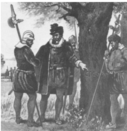
Their Fortune and Probable Fate.

Los primeros colonizadores ingleses permanentes que vinieron a Carolina del Norte inmigraron del área de Tidewater en el sudeste de Virginia. El primero de este exceso de colonizadores se mudó a Albemarle, en el noreste de Carolina del Norte, por el 1650.