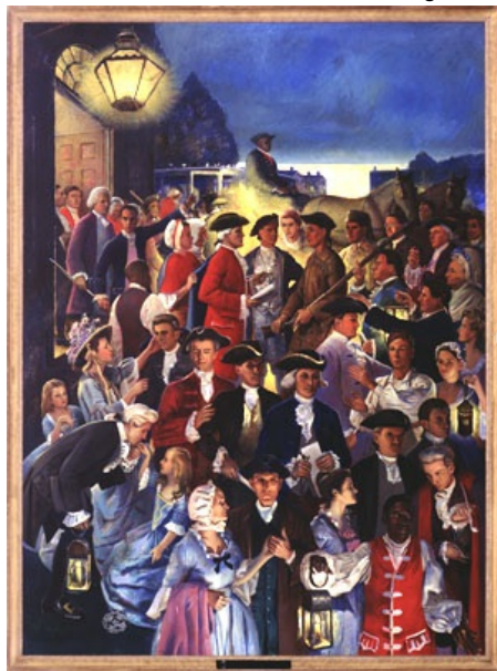
"Halifax Resolves" de Francis Vandever Kughler.

El 12 de abril de 1776, Carolina del Norte autorizó a sus delegados al Congreso Continental a votar por la independencia. Esta fue