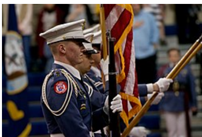
Un guardia de color de la Academia Militar de Oak Ridge (2015)

La declaración de la misión de la academia es: